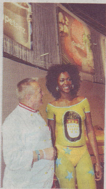
Ein Model als Werbefigur für den Kochverein.

knüpft. 12 000 verkaufte Karten kann Pressesprecher Jürgen Sziogoleit vermelden.